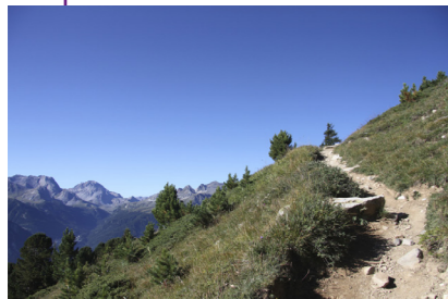
Au plus près du terrain