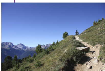
Au plus près du terrain