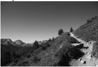
Au plus près du terrain